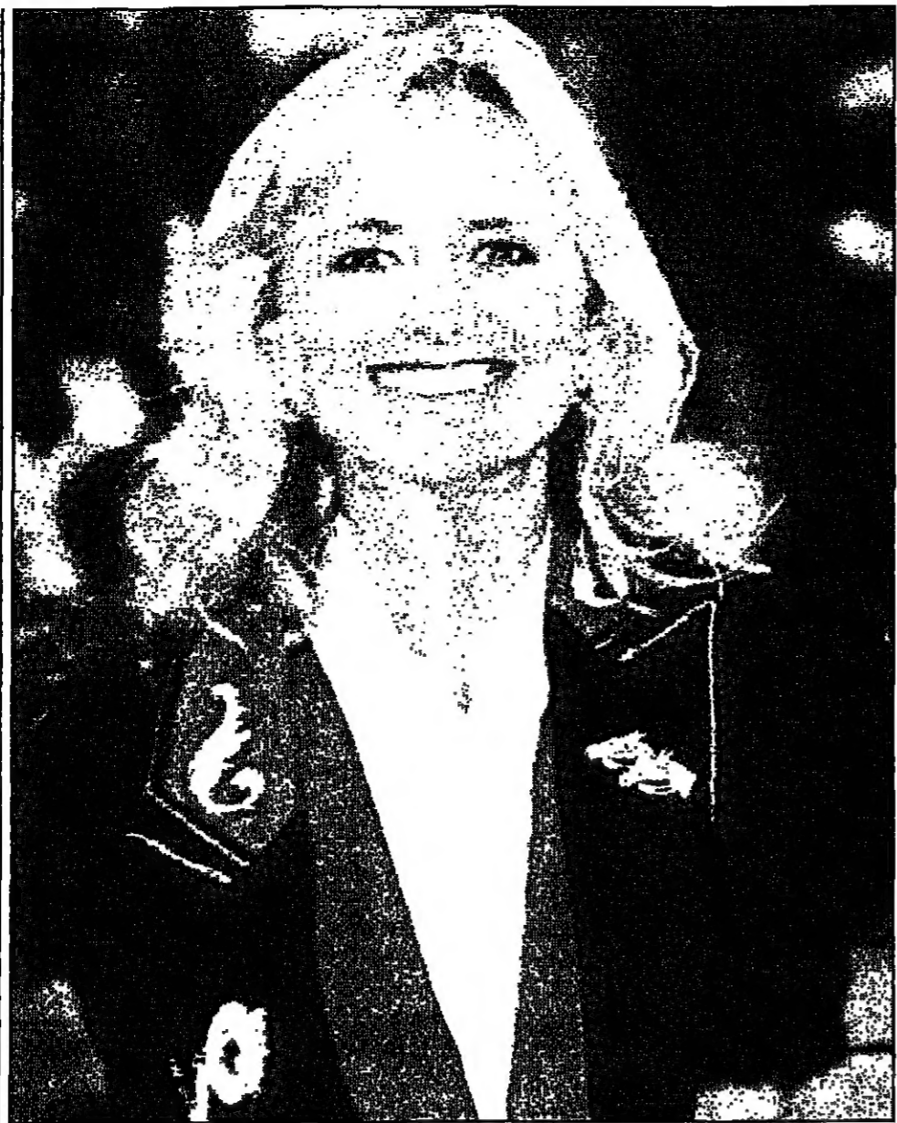
الملكة البريطانية سوران جورج كانت من بين النجوم والمشاركين الذين شاركوا في متابفة بطولة كأس العالم للخيول في دبي امس الاول

نيويورك - رويترز: قالت متحثة باسم أحد مستشفيات نيويورك الخميس ان ستة توأم ولدوا في المستشفى في واقعة نادرة.